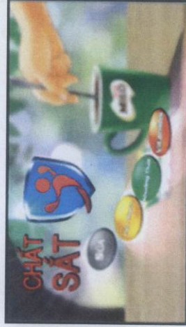
...Để khỏe mạnh năng động nên 4 3 2 mỗi ngày.