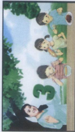
.. thật nhiều dinh dưỡng cho 3 bữa ngon..