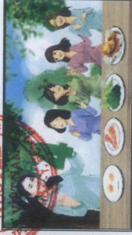
4 món ăn giàu sắt mỗi ngày...