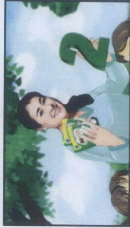
... và 2 MILO thêm sắt (2 MILO thêm sắt)...