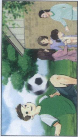
Mẹ 1: Cu Tí nhà chị năng động ghê á, còn tui nhò nhà tui sao cứ hay bị mệt dù ăn uống cũng đầy đủ lắm!